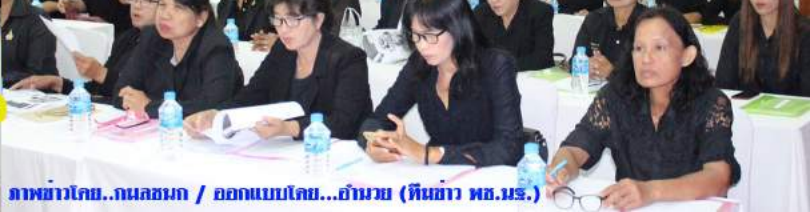
ภาพข่าวโดย..กมลฉก / ออกแบบโดย...ธันนวย (หินฉ่า พจ.นฐ.)